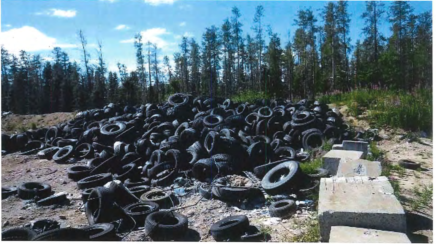
IMGP0423 (640x360).jpg Photo 4 : Partie écocentre : Pneus