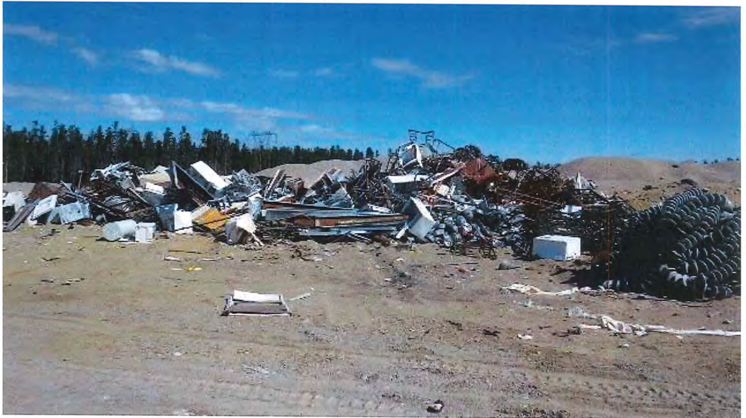
IMGP0425 (640x360) - Copie.jpg Photo 5 : Partie écocentre : Métal